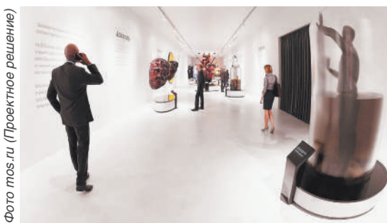
(Проектное решение)

Подробная программа Московского урбанистического форума и карта выставочного пространства доступны на официальном сайте.